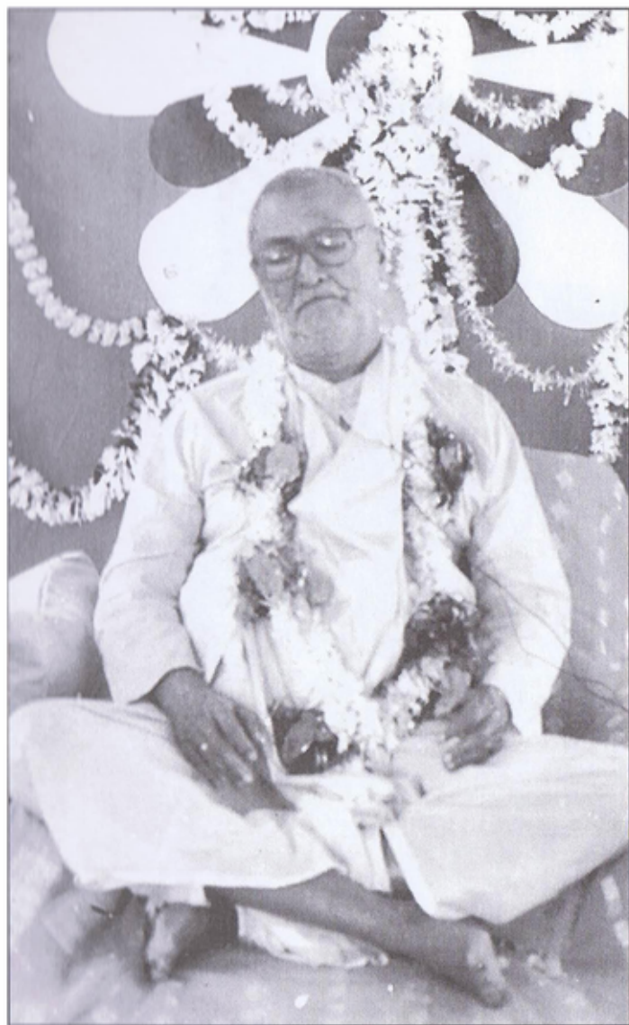
ঔ বিষ্ণুপাদ শ্রীশ্রীল ভক্তিরক্ষক শ্রীধর দেবগোস্বামী মহারাজ