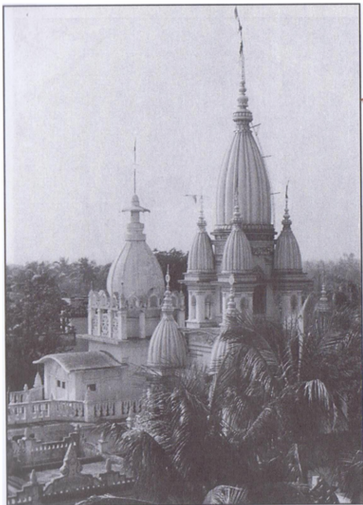
শ্রীচৈতন্য-সারস্বত মঠ, নবদ্বীপ